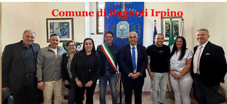
Comune di Bagnoli Irpino

culturale ed enogastronomico campano, anche attraverso la partecipazione attiva dei Comuni coinvolti.