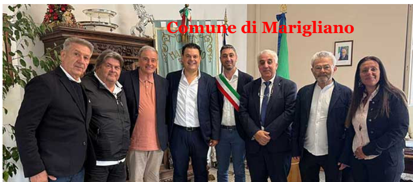
Comune di Marigliano