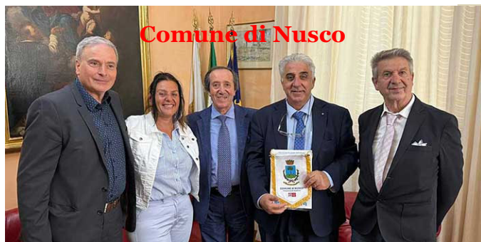
Comune di Nusco