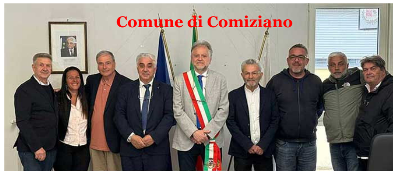
Comune di Comiziano